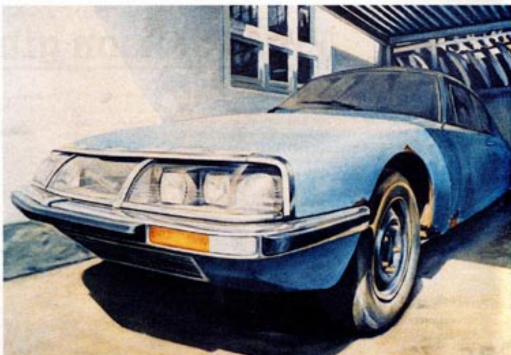
Auto-Stilleben von Martin Reukauf an der Jungkunst.ch: Der Citroën SM war eine Zusammenarbeit mit Maserati aus dem Jahr 1970.

Weg vom elitären Gehabe der Galerien – hier kommt junge Kunst!