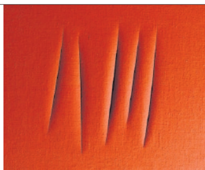
Luciano Fontana, «Concetto spaziale, Attese», 1964, signiert und datiert, 46x55 cm, Schätzpreis: 960 000 bis 1,3 Mio. $, Zuschlagspreis: 1,6 Mio. $ (Christie's)