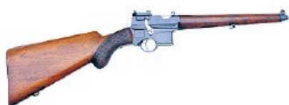
Männlicher Pistolencarabiner 1897/01, Kaliber 7,65x25, Jagdkarabiner, hergestellt von SIG Neuhausen, selten, Ausrufpreis: 9000 Fr., Schätzpreis: 18 000 Fr. (Kessler)

Tel. 071 671 23 24, www.kesslerauktionen.ch Auktion: 6. November Sammlerwaffen