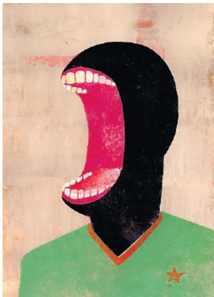
Stephan Schmitz, «Portrait Series», 2010, Öl auf Papier, 50x65 cm, Preis: um 700 Fr.