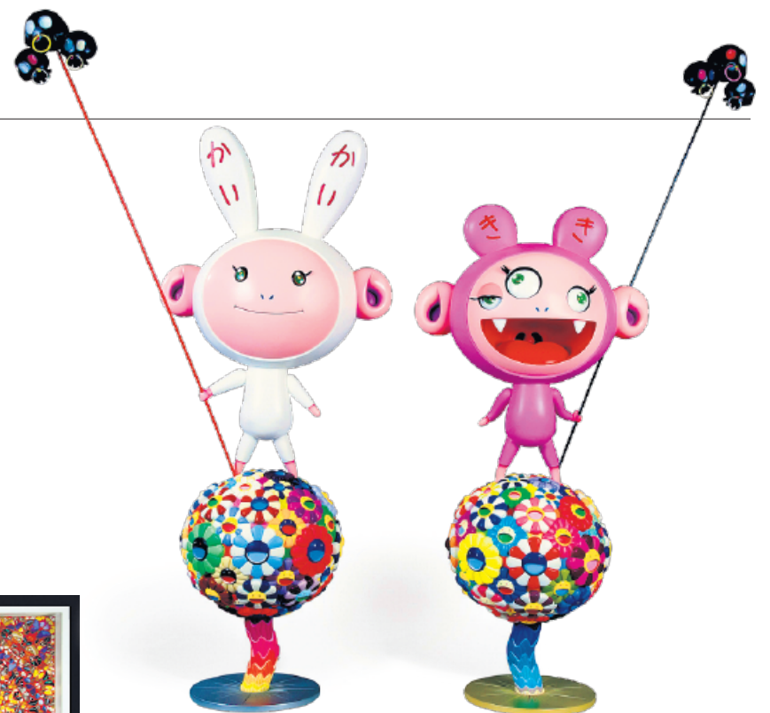
Takashi Murakami, «Kaikai Kiki», 2005, bemalte Stahl- und Fiberglasskulpturen, aus einer Edition von fünf Exemplaren, Höhe von Kaikai: 210 cm, Höhe von Kiki: 212,5 cm, Schätzpreis: 640 000 bis 960 000 $, Zuschlagspreis: 3,1 Mio. $ (Christie's, Daniella Luxembourg, Kunsthandel und Kunstberatung, London, Genf, New York)