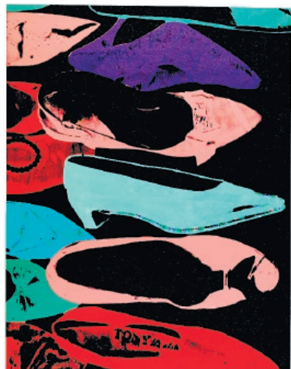
Andy Warhol, «Diamond Dust Shoes», 1980, Acryl, Siebdruckfarbe und Diamantstaub auf Leinwand, 228,6x177,8cm, Schätzpreis: 2,1 bis 2,6 Mio. $, Zuschlagspreis: 2,5 Mio. $ (Sotheby's, an Pym's Gallery, London)